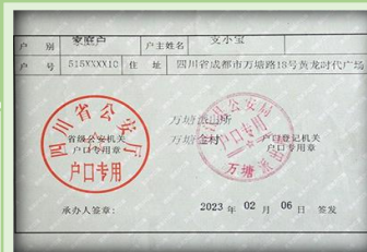
(户口本首页示例图)

二、被保险人有效身份证件照片正反面, 如: 居民身份证 (包括临时身份证)、户口本 (未满3周岁儿童未办理户口本, 以出生证明替代户口本) 注: 户口本需要提供首页及本人页 (户口本首页如右图)